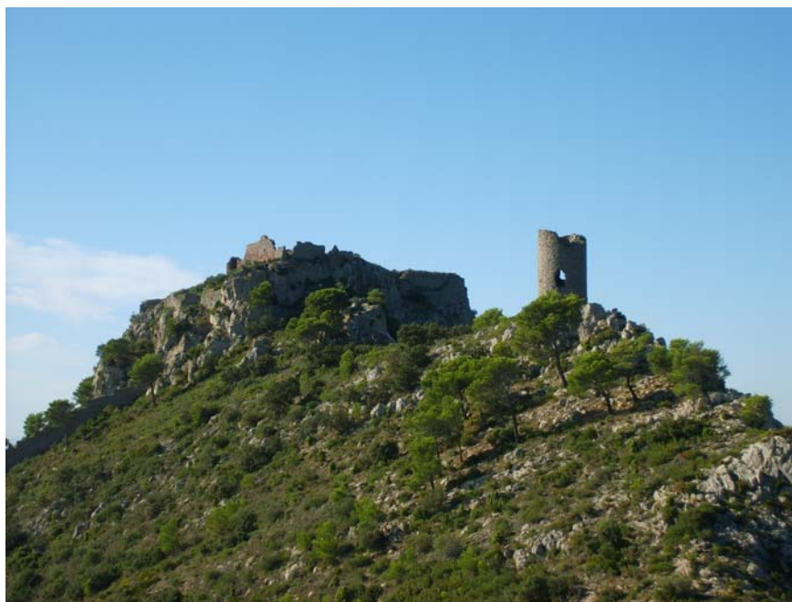
Desert de les Palmes

- PARQUE NATURAL DEL DESIERTO DE LAS PALMAS del 1/09/2008 a 15/09/2008